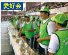
愛好会 インターアクトクラブ