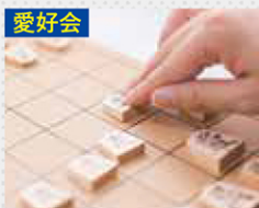
愛好会 将棋愛好会