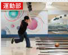
運動部 ボウリング部