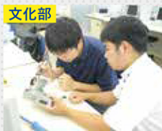
文化部 モノづくり倶楽部