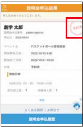
8 申し込み完了画面 「予約済」のマークが表示されれば予約完了です。