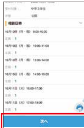
2 相談日時の確認 参加人数に上限があります。確認の上、タップしてください。