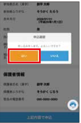
7 申し込み確定ボタン 「はい」を選択して申し込み完了です。