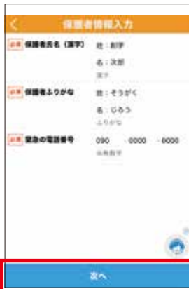
5 保護者情報の入力 保護者情報を入力後、タップしてください。