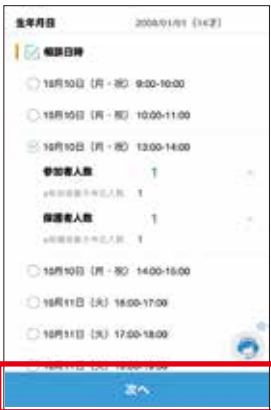
3 相談日時の選択 「相談日時」を選択してタップしてください。