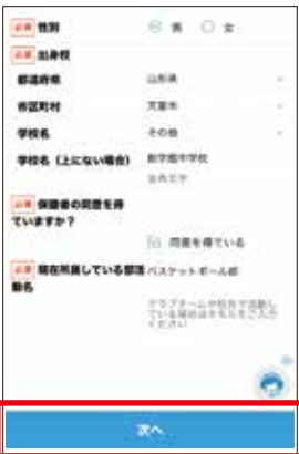
4 参加者情報の入力 参加者情報を入力後、タップしてください。