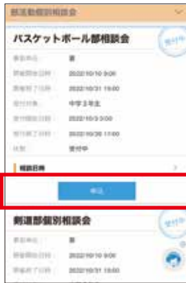
1 イベント申し込み画面 相談したい部活動を確認して、「申込」をタップしてください。